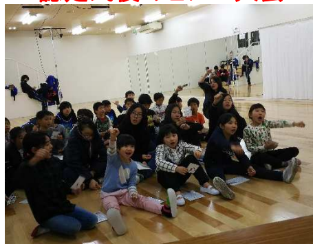
認定式後のビンゴ大会