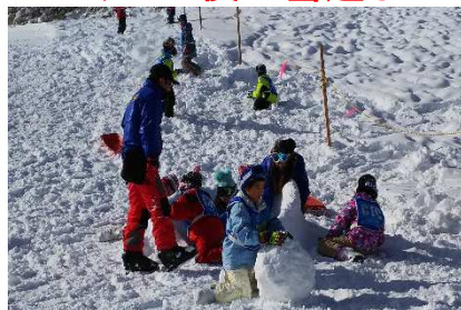
レッスン後の雪遊び